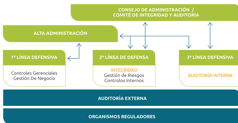
Imagen: Ejemplificación de las líneas de defensa de la empresa

Core Compliance: la evaluación y el seguimiento sistemáticos de los procesos clave del Programa de Integridad sobre la base de indicadores que permitan comprobar el funcionamiento de los controles implementados. El cumplimiento efectivo de los indicadores y metas de Integridad es parte importante de la evaluación del desempeño de los integrantes.